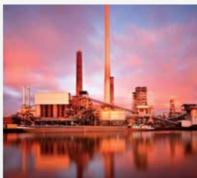
Нефтехимическая / химическая промышленность