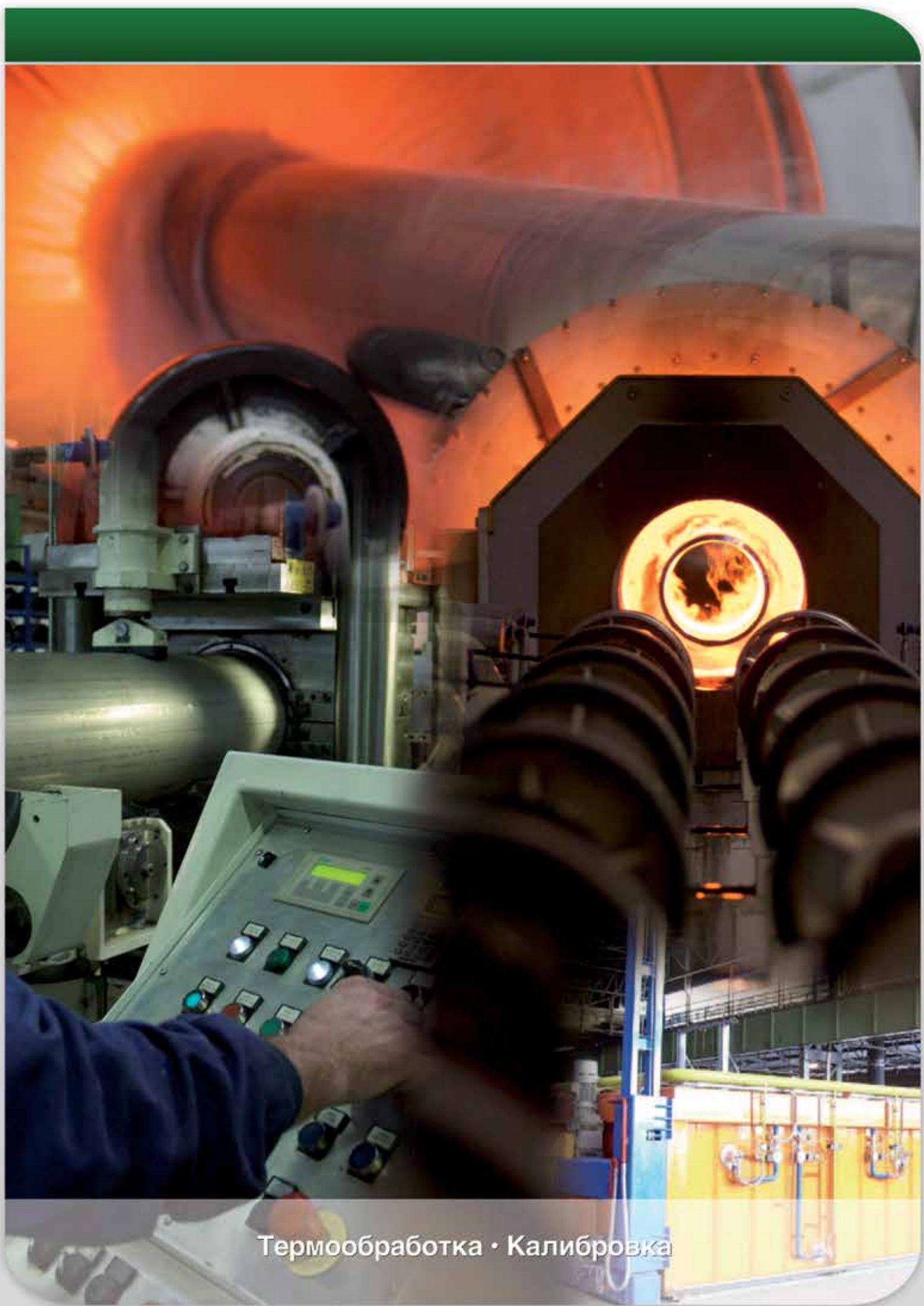
Термообработка · Калибровка